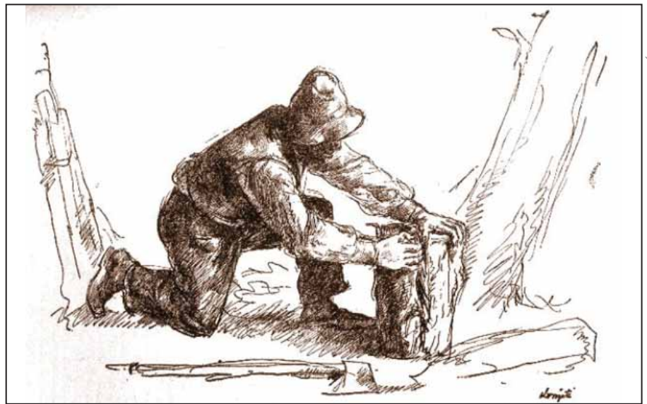
FAVÁGÓ: KOMIÁTI GVULA TOLLRAZA

Az öreg favágó értetlenül rázta a fejét: „Hát már soha nem fogják föl ezek az emberek?” - „Hogy áldás-e vagy átok, nem tudom megítélni. Annyit tudok csak, hogy újra itt a lovam, és tíz vadlova hozott magával.”