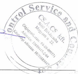
Sztán Csilla Ilona bejegyzett könyvvizsgáló MKVK 002854