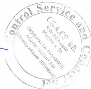
Sztán Csilla Ilona bejegyzett könyvvizsgáló MKVK 002854