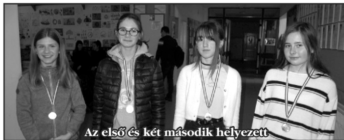
Az első és két második helyezett

G yulán rendezték meg az idei Diákolimpia Megyei Egyéni Sakk döntőjét. A versenyen 89 gyermek indult hat korcsoportban. Az első és második korcsoportban együtt indultak a versenyzők és az amatőrök, ezért innen az első három-három helyezett került be az országos döntőbe.