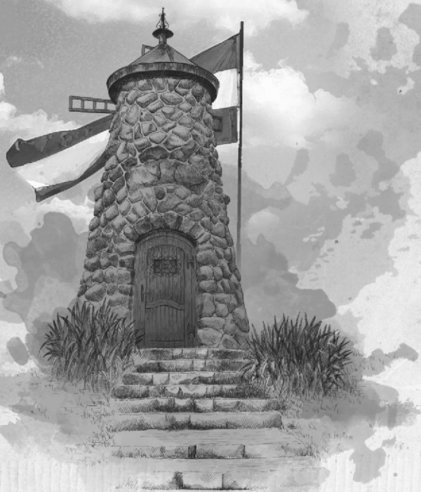
grafika: Zsada - képgrafikus

Szarvas Város Önkormányzata a Szarvasi Történelmi Emlékút Közalapítvány és a Centenárium Hagyományörző Honvéd Gyalogdandár tisztelettel meghívja Önt és családját