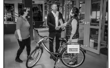
Körös18 kerékpáros kör